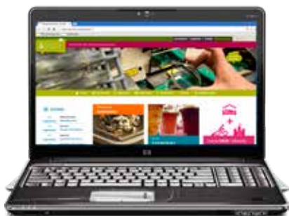
Site internet www.tourisme-barleducetbarrois.com