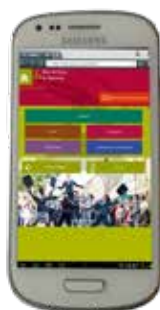
Site web mobile mobi.tourisme-barleduc.fr