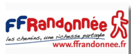
5 circuits en cours de labellisation FFRP