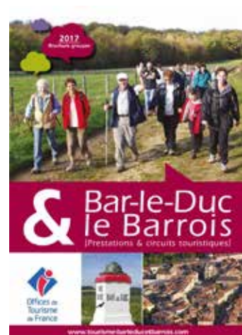
BROCHURE GROUPES Destinée aux prescripteurs autocaristes et associations