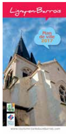
PLANS DE VILLE Bar-le-Duc Ligny-en-Barrois