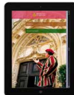
Application « Bar-le-Duc, cité Renaissance »