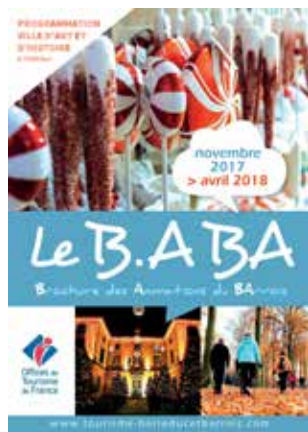
BROCHURE DES ANIMATIONS DU BARROIS Edition semestrielle