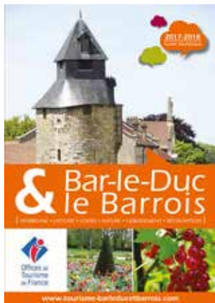
BROCHURE D'APPEL Bar-le-Duc & le Barrois En français et anglais/allemand

48 000 brochures éditées et diffusées annuellement