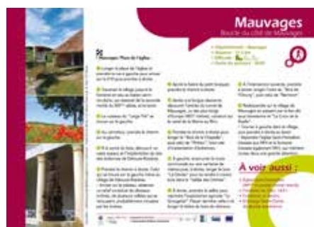
19 fiches de randonnée pédestre éditées en 2017 en format papier à l'Office de Tourisme ou consultable sur le site internet : www.tourisme-barleducetbarrois.com