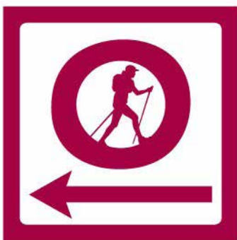
Un balisage commun

Les collectivités du sud meusien se sont engagées depuis 2016 à la remise en état de leurs circuits de randonnée. Objectif : proposer une offre « randonnée » de qualité