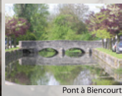
Pont à Biencourt